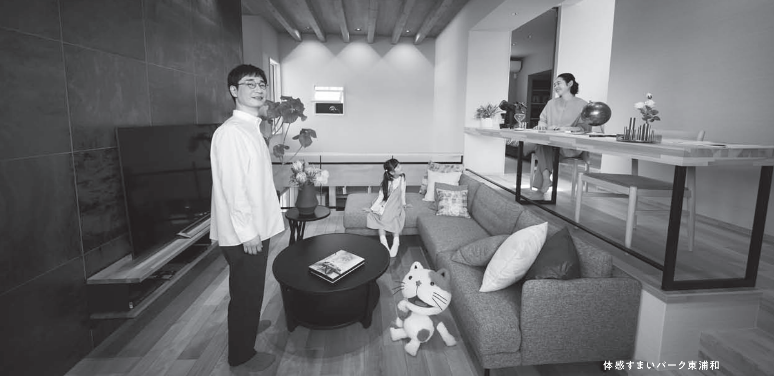
体感すまいパーク東浦和