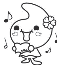
埼玉県合唱連盟キャラクター「たまりん♪」