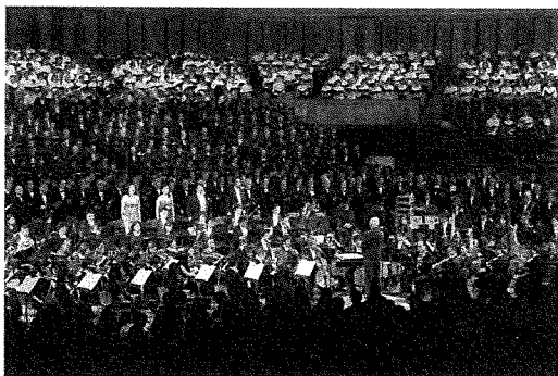
H29.2.12 ベートーヴェン「第九」演奏会

全国初となる2度目の国民文化祭開催を契機に、世界的に有名な指揮者である秋山和慶氏を音楽監督にお迎えし、徳島に共感を持つプロの音楽家が本県に集うオーケストラとして、2011年9月に設立。「第27回国民文化祭・とくしま2012」プレフェスティバルや総合フェスティバルでの演奏をはじめ、2012年から定期演奏会、2013年からクラシック入門コンサートを毎年開催。2014年には徳島ヴォルティスJ1ホーム開幕戦記念演奏会や第25回全国「みどりの愛護」のつどいにおいて演奏。県内各地での演奏活動、学校や音楽団体等への指導を通して、県民の皆様にも優れた一流の芸術を身近に感じていただくとともに、音楽文化の裾野を広げ、地域の活性化を図る「音楽文化が息づくまちづくり」を力強く牽引しています。